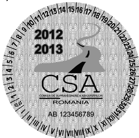
Fața sticker CSA