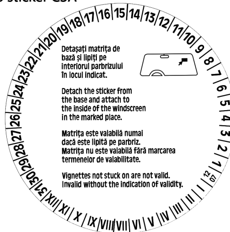
Verso sticker CSA